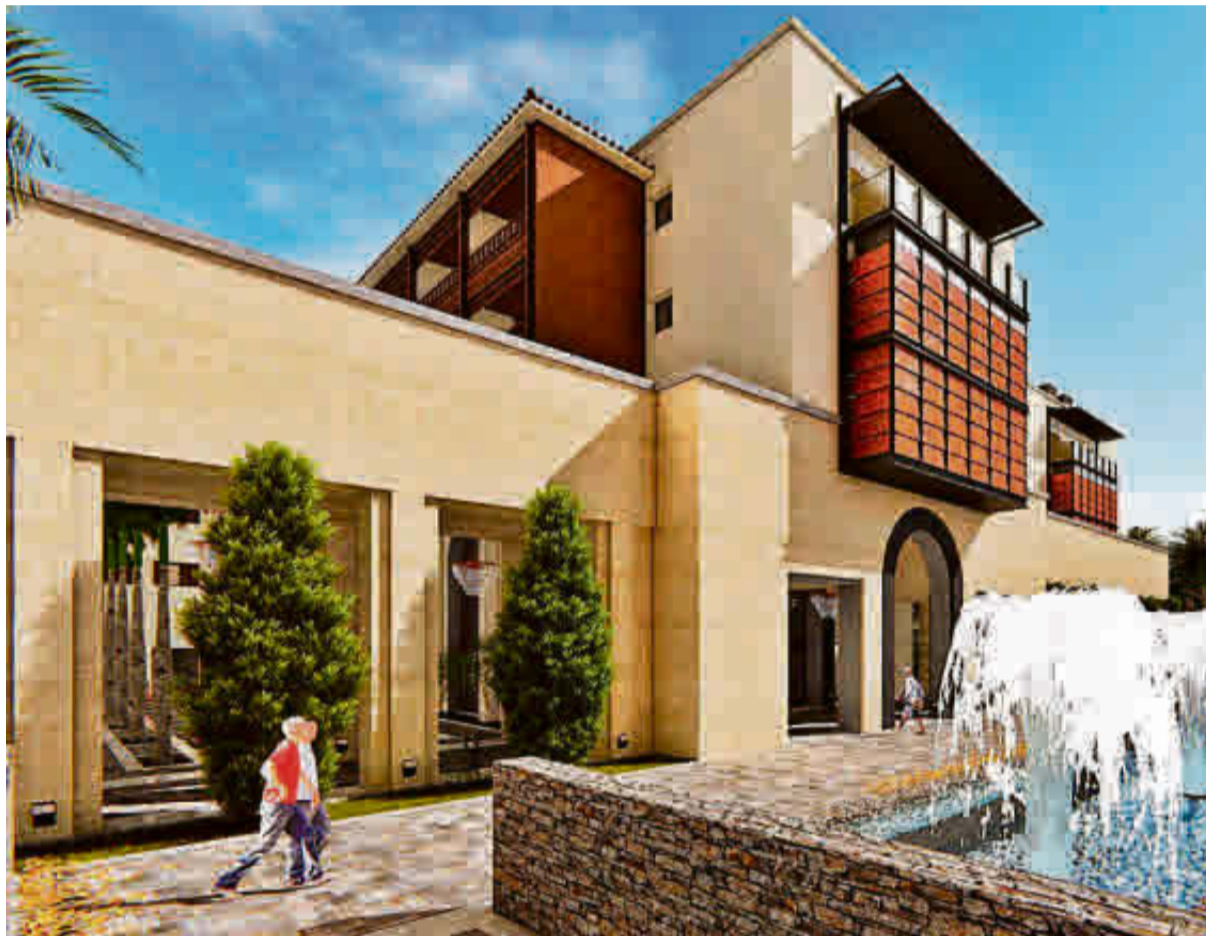
Recreación del proyecto para el hotel, en su parte trasera.