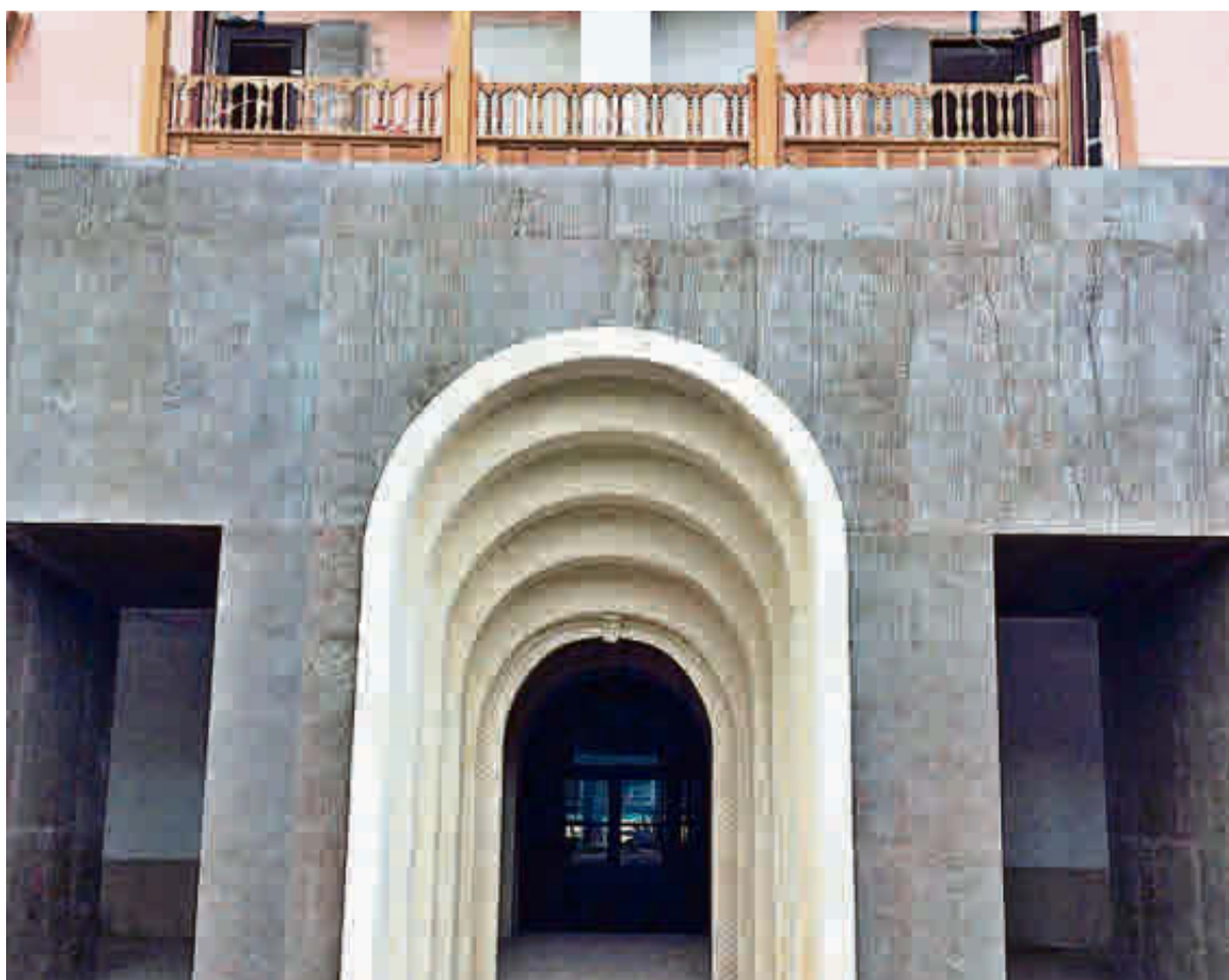
Nuevos elementos constructivos en el hotel.